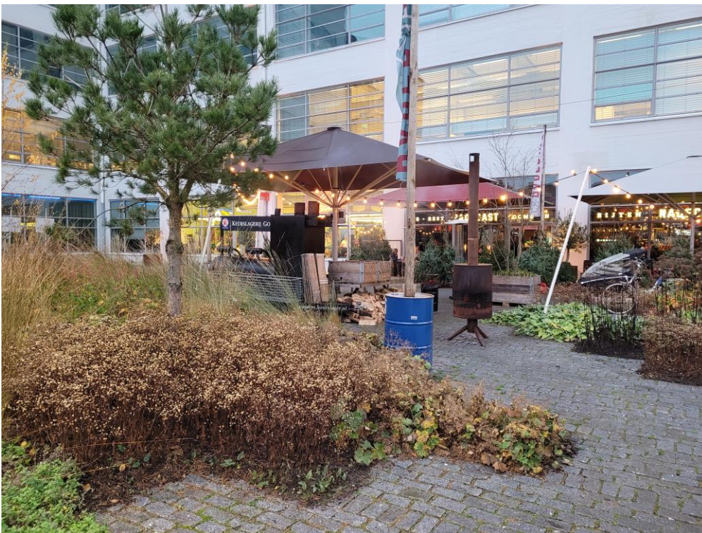
Winterse sferen op het Clausplein