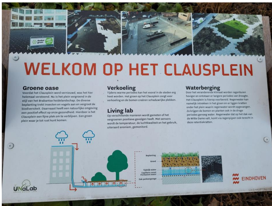
Informatiebord van de gemeente Eindhoven op het vernieuwde Clausplein

Het bedrijf Donker Groep nam in opdracht van de gemeente Eindhoven het ontwerp, de inrichting en het onderhoud van het nieuwe Clausplein op zich. Volgens Donker Groep was het plein in de oude situatie weliswaar bedoeld als 'verblijfsplein', maar werd het nauwelijks als zodanig gebruikt. Het plein oogde "sfeerloos", er was "gebrek aan groen", "een extreem klimaat" en "grote windbelasting". De ontwerpers hebben het nieuwe plein daarom bedacht als "een groen plein waar het fijn verblijven is". Bijzonder aan dit "klimaatbestendige plein" is volgens de ontwerpers het hergebruik van hemelwater via een waterretentiesysteem, dat op het dak van de parkeergarage onder het plein is aangelegd. Om deze reden is er ook gekozen voor onderhoudsarme beplanting, die tegelijkertijd bijdraagt aan de biodiversiteit. De bomen zijn op heuvels geplant zodat de wortels voldoende ruimte hebben om te groeien.