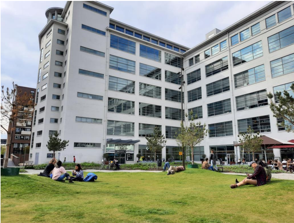
Zaterdagmiddag, voorjaar op het Clausplein: groepjes jongeren zitten op de heuveltjes, een man ligt languit op de heuvel. Op de achtergrond recht een vol terras, links een groepje kinderen dat cricket speelt voor de Witte Dame.

Het plein vervult niet alleen een verblijfs- en ontmoetingsfunctie, maar ook een doorstroombaan, als route van en naar de binnenstad. Er lopen veel mensen voorbij met tassen van winkels die in de binnenstad zijn gevestigd. De mensen dragen zonnebrillen, hebben een ijsje of broodje in hun hand, of duwen een kinderwagen voort. Alle leeftijden komen voorbij: jongeren, studenten, jonge gezinnen met kinderen en senioren. Een aantal voorbijgangers is op de fiets of neemt deze aan de hand mee, andere manoeuvreren al fietsend over het plein. Honden worden ook op het plein uitgelaten. Een man in een geel hesje leegt de afvalbakken. Het plein oogt netjes met weinig zwerfafval, voorbijgangers gooien hun afval keurig in de bakken.