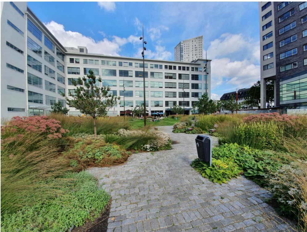
De weelderige beplanting van het Clausplein op een zomerdag

In de zomer kan het druk worden op het terras, maar ook op de bankjes en op het gras stroomt het dan snel vol. Meer en meer mensen lijken het plein weten te vinden als plek om buiten te relaxen, bij te praten of om 'mensen te kijken'. Was de beplanting in het voorjaar nog laag, nu schiet een scala aan bloemen en planten de grond uit. Ook in de najaarszon is het plein nog volop in gebruik, bijvoorbeeld tijdens de Dutch Design Week, wanneer je veel Engels hoort op het plein. Toeristen kijken op hun telefoon om de weg te vinden, of strijken even neer op het terras of in het gras. Zo nu en dan is het geluid van een rolkoffer te horen.