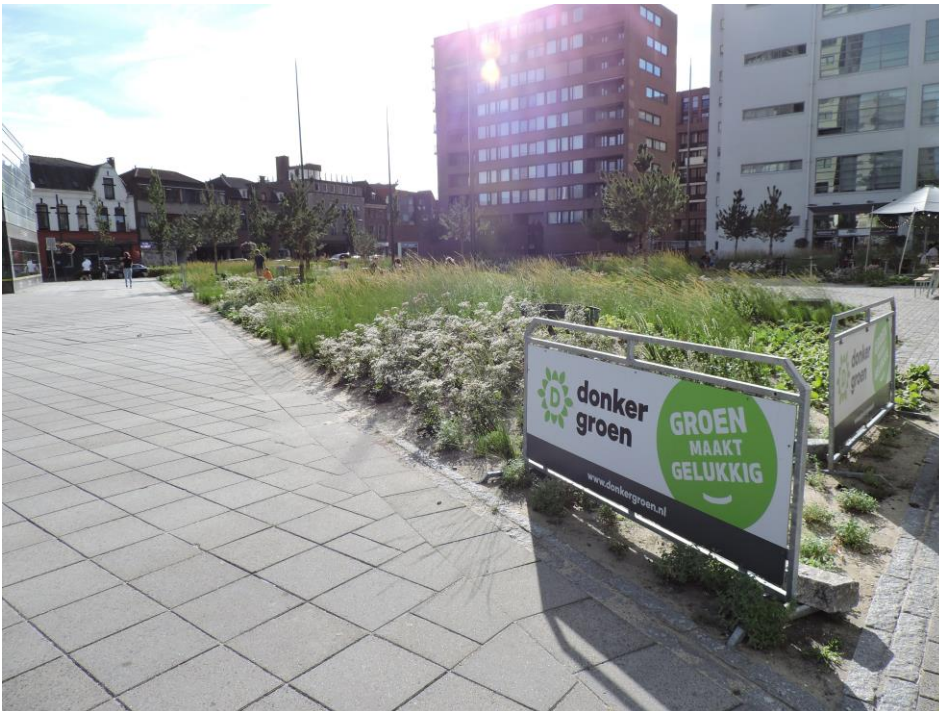
Bord met claim van ontwerper en uitvoerder Donker Groen: een groen plein dat gelukkiger maakt

De gemeente Eindhoven ziet daarnaast een belangrijke functie als verblijfsplek voor het plein weggelegd. Zo stelt de gemeente Eindhoven: “Met bankjes, grasheuvels en terrassen is het echt een plek geworden om te verblijven.” 6 Wethouder Thijs constateerde al snel dat de transformatie tot verblijfsplek was geslaagd: “De winkels eromheen komen tot leven en slaan de deuren naar buiten open en de burgers komen er nu vaker om te verblijven en te recreëren.” 7