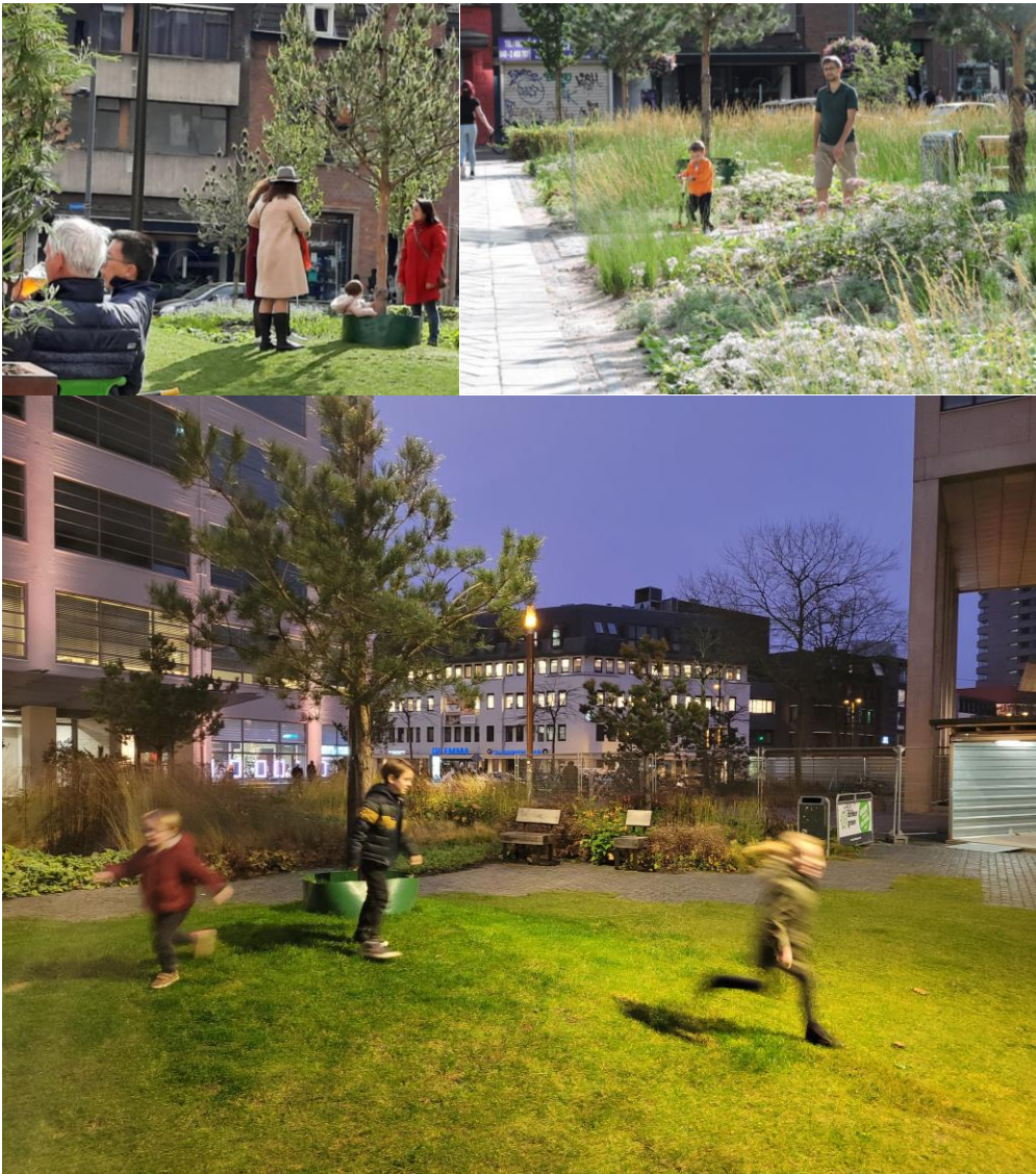
Het Clausplein wordt gebruikt als speelplaats

Op doordeweekse dagen is het Clausplein ook het terrein van groepjes studenten en scholieren, die vaak rugzakken dragen en eten en drinken meenemen. Sommige groepjes gaan zitten op het gras om tegen de heuvels aan te kunnen leunen. Rond lunchtijd is het plein onder kantoorpersoneel een geliefde plek om aan te doen tijdens de lunchwandeling of om even in de zon te zitten. Een vrijkomend bankje wordt snel weer opgevuld. Ouderen maken een wandelingetje over het plein en mensen met koptelefoons lopen voorbij. Bij mooi weer zijn er ook mensen op het terras te vinden. Kinderen spelen tikkertje op het gras. Baasjes lopen een rondje met hun hond via het plein.