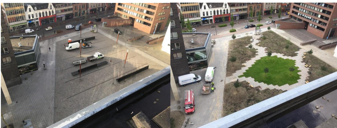
Het Clausplein voor en (vlak) na de transformatie.

Op het eerste oog lijkt de transformatie van het Clausplein succesvol, maar beleven bewoners en bezoekers van de Eindhovense binnenstad het Clausplein nu ook daadwerkelijk anders? Wordt de hogere biodiversiteitswaarde ook opgemerkt door de bewoners en bezoekers? Welke rol speelt het plein in het dagelijks leven in Eindhoven? In een etnografisch onderzoek verdiepte Sweco zich in het gebruik en de beleving van het plein, door middel van observaties en straatinterviews.