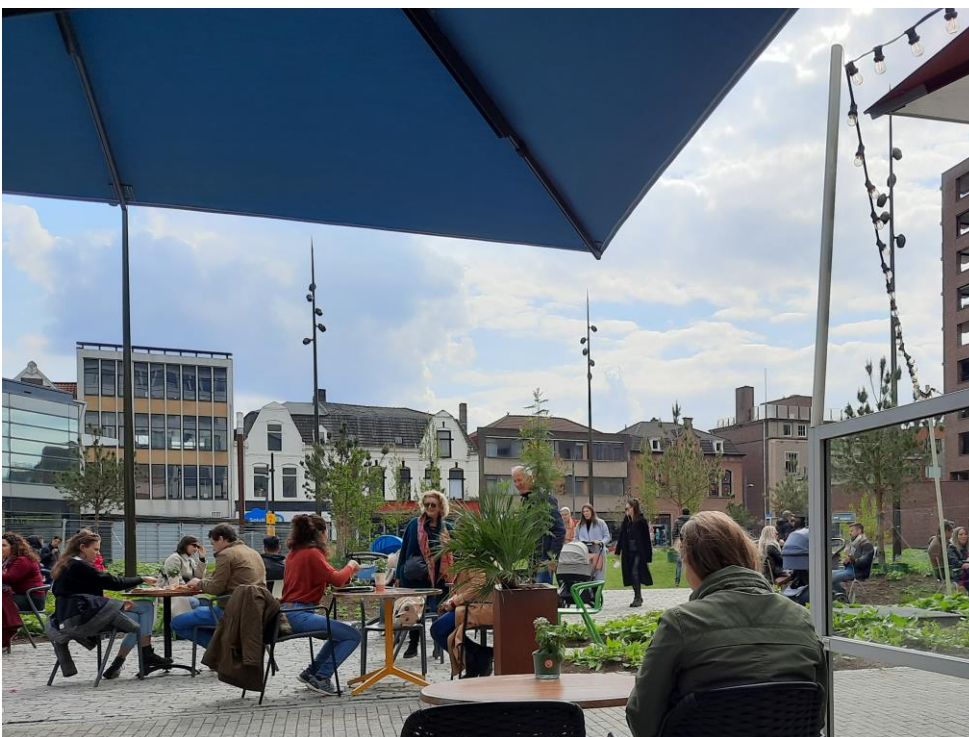
Ontmoetingen op een vol, 'coronaproof' terras van DENF Coffee.

Op deze zonnige middag is er ook meteen reuring te vinden op het Clausplein.